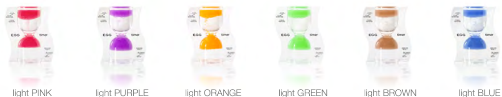
light PINK light PURPLE light ORANGE light GREEN light BROWN light BLUE

For the perfect PARADOX breakfast egg Offbeat accessory in the kitchen Cool gift Ideal for Easter egg hunts