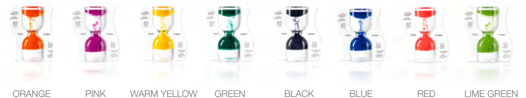
ORANGE PINK WARM YELLOW GREEN BLACK BLUE RED LIME GREEN

The steeping time can be varied depending on the type of tea Exceptional accessory for tea lovers Humorous addition to a gift of tea Eye-catcher in the tea shop/teahouse during preparation